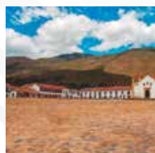
BOYACÁ Salida: JULIO