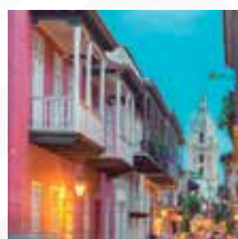
CARTAGENA Salida: SEPTIEMBRE