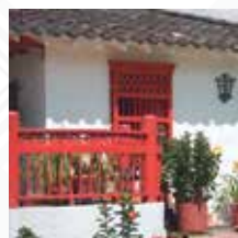
EJE CAFETERO Salida: MAYO