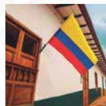
SANTANDER Salida: JUNIO