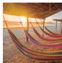
GUAJIRA Salida: OCTUBRE