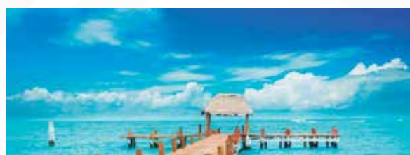
CANCÚN Salida: MAYO