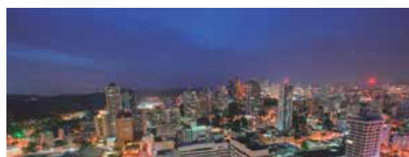
PANAMÁ Salida: OCTUBRE

Para mayores informes visítanos en la oficina de Bancoomeva de tu zona con los Asesores Integrales o contáctenos en el teléfono: 8280896 Ext. 45010 – 45023.