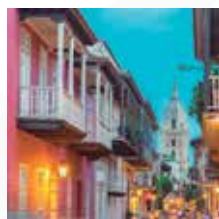
CARTAGENA Salida: SEPTIEMBRE