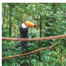
AMAZONAS Salida: MARZO