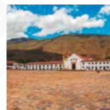
BOYACÁ Salida: JULIO