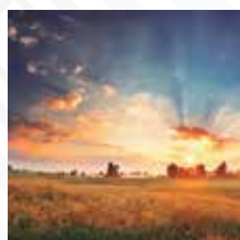
LLANOS ORIENTALES Salida: ABRIL