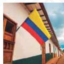
SANTANDER Salida: JUNIO