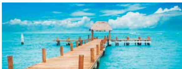
CANCÚN Salida: MAYO