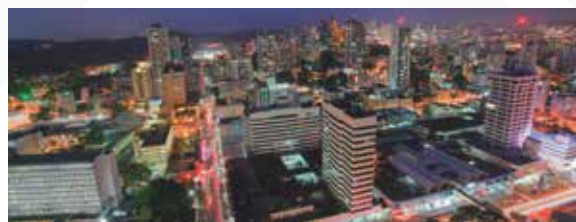
PANAMÁ Salida: OCTUBRE

Para mayores informes visítanos en la oficina de Bancoomeva de tu zona con los Asesores Integrales o contáctenos en el teléfono: 7812181 Ext. 45010 – 45023.