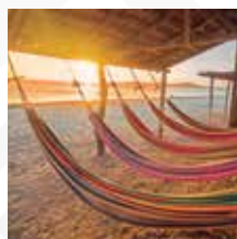
GUAJIRA Salida: OCTUBRE