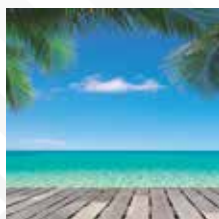
BAHÍA SOLANO Salida: AGOSTO